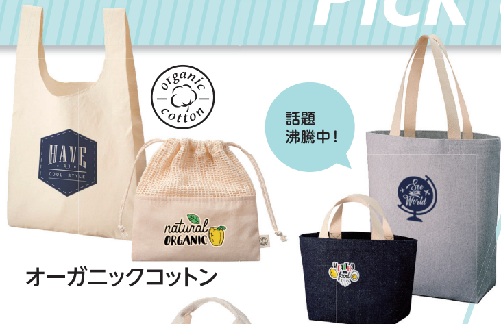
オーガニックコットン