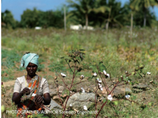
PHOTOGRAPHER/AUTHOR Santiago Engelhardt