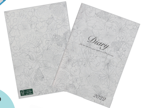
リサイクルペーパー R70