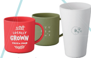
バンブーファイバー