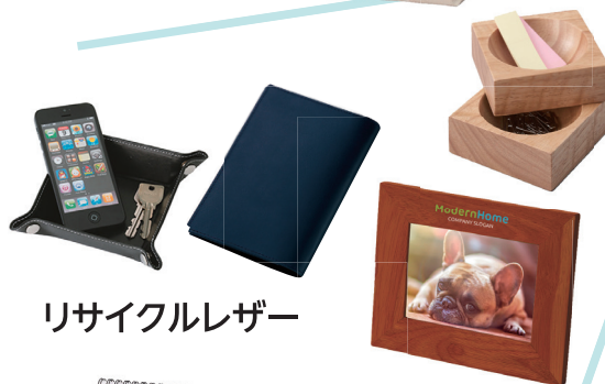
リサイクルレザー