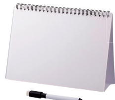
エコステーションナリー (ホワイトボード型ノート)